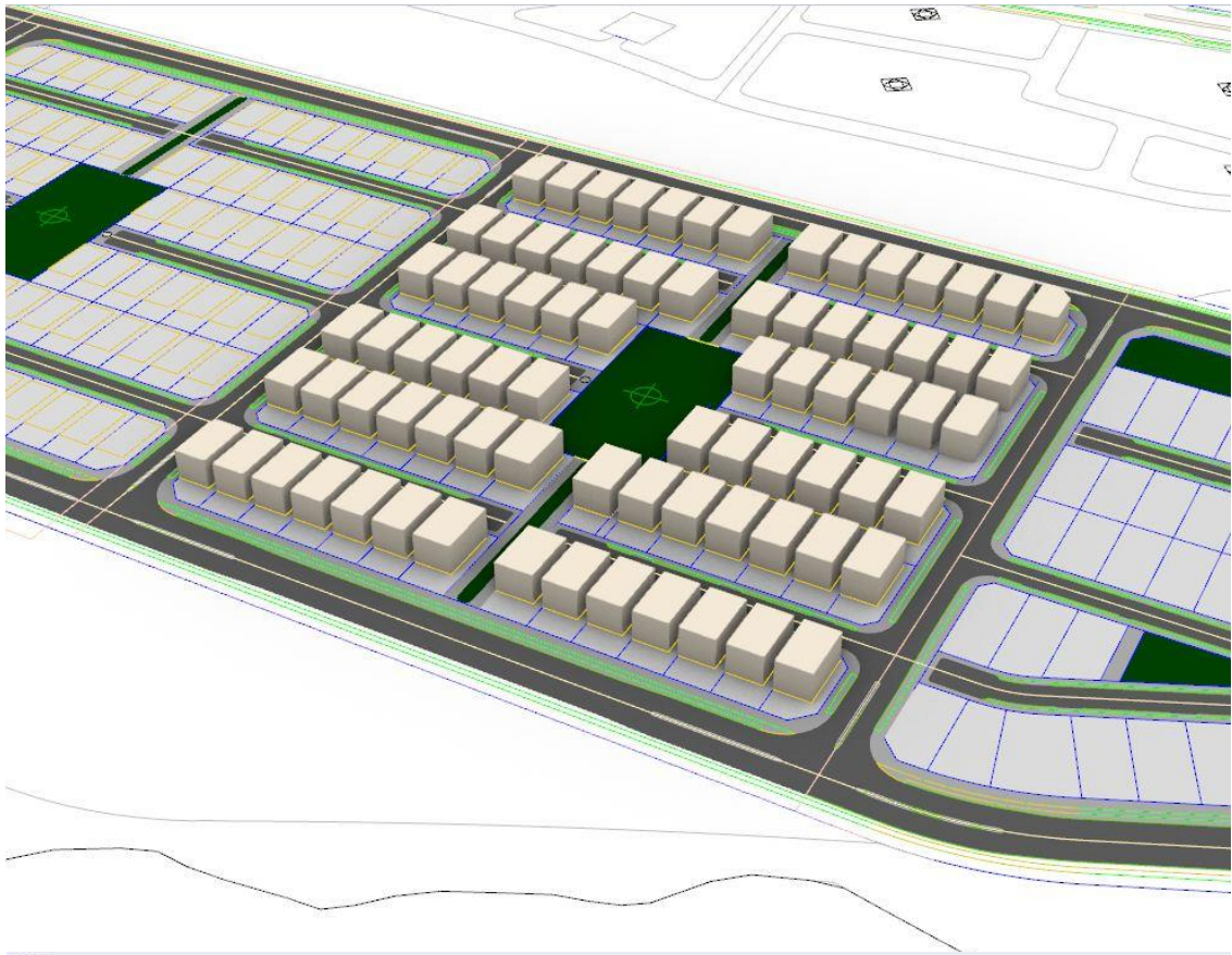
تصاویر سه بعدی مجموعه مسکونی تیاب ۶